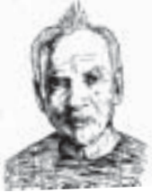
पं० श्रीराम शर्मा आचार्य

युग निर्माण अभियान जिसे लेकर गायत्री परिवार निष्ठा और तत्परतापूर्वक अग्रसर हो रहा है, उसका बीज युगऋषि वेदमूर्ति, तपोनिष्ठ पं० श्रीराम शर्मा आचार्य जी द्वारा विनिर्मित यह सत्संकल्प है। यह हमारे प्रयासों का एक सुनिश्चित प्रारूप-घोषणा पत्र है, जिसके आधार पर हमारी सारी विचारणा, योजना, गतिविधियाँ एवं कार्यक्रम संचालित होंगे। इसका प्रत्येक सूत्र व्यक्ति, परिवार, समाज एवं राष्ट्र को आमूलचूल बदलने की आधारशिला के रूप में रखा गया है। एकता, समता की सर्वांगपूर्ण रूपरेखा- वसुधैव कुटुम्बकम् की समग्र परिकल्पना इसमें की गई है। इस घोषणा पत्र को हम ठीक प्रकार से समझें, उस पर मनन और चिंतन करें तथा यह निश्चय करें कि हमें अपना जीवन इसी ढाँचे में ढालना है। दूसरों को उपदेश करने की अपेक्षा इस संकल्प पत्र में आत्म निर्माण पर सारा ध्यान केन्द्रित किया गया है। एक-एक अच्छा मनुष्य मिलकर ही अच्छा समाज बनेगा।