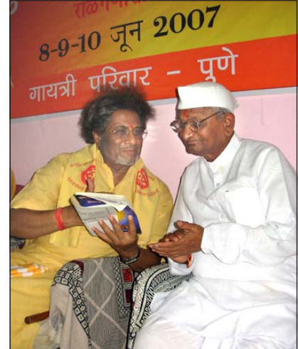
दीपयज्ञ की वैज्ञानिकता और सामाजिक उपयोगिता पर आदरणीय प्रणव पण्ड्या जी से चर्चा करते माननीय अण्णा हजारे

महाराष्ट्र के पुणे महानगर से लगभग १०० कि.मी. दूर पहाड़ियों के बीच बसा है एक आदर्श गाँव-रालेगण सिद्धि। वहाँ ८, ९ तथा १० जून की तिथियों में युवा चेतना शिविर उत्साहपूर्वक हुआ। इसमें पुणे, मुम्बई, नाशिक, औरंगाबाद,